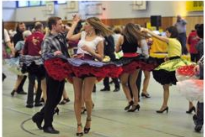
So heiß geht's her beim Square Dance in Stellingen.

Alljährlich zu Pfingsten wird Hamburg, von den meisten Hanseaten unbemerkt, zum Mekka der deutschen Square Dancers: Mehr als 700 Tänzerinnen und Tänzer treffen sich in der Sporthalle am Wegenkamp (Stellingen) zum traditionellen „Hummel Dance“. Und die MOPO am Sonntag stellte fest: Die tanzen nicht nur im Quadrat!